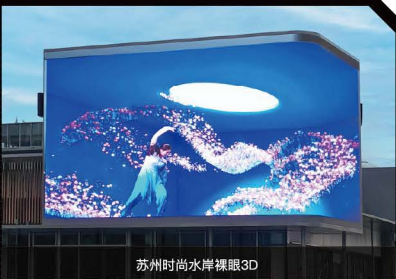
苏州时尚水岸裸眼3D