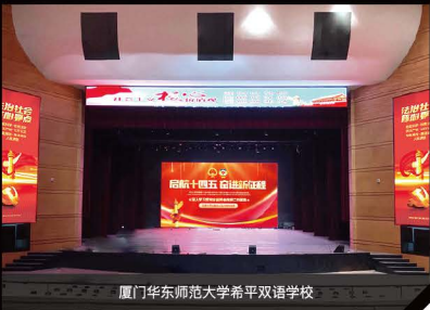
厦门华东师范大学希平双语学校