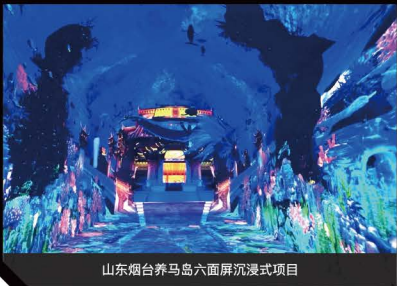
山东烟台养马岛六面屏沉浸式项目